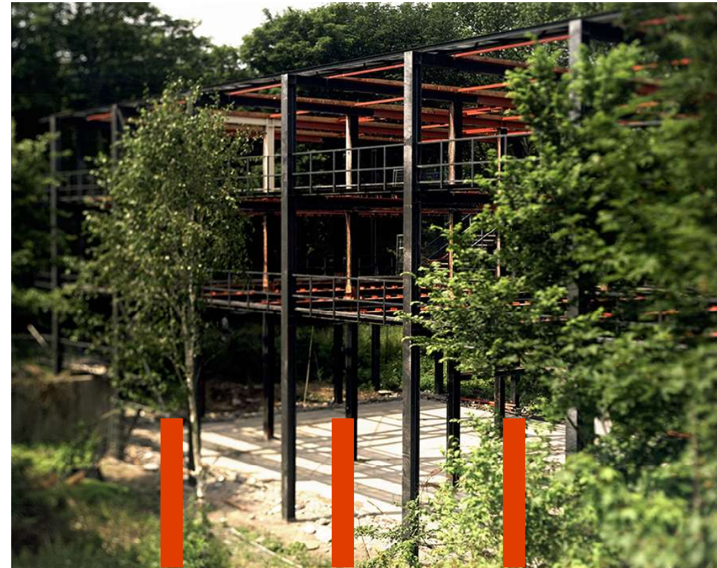
Jeugdherberg van Van Klingereren 1971/74-2010

Het zijn praktijken die zich niet laten leiden door de waan van de dag, maar een doorleefde basis kennen.