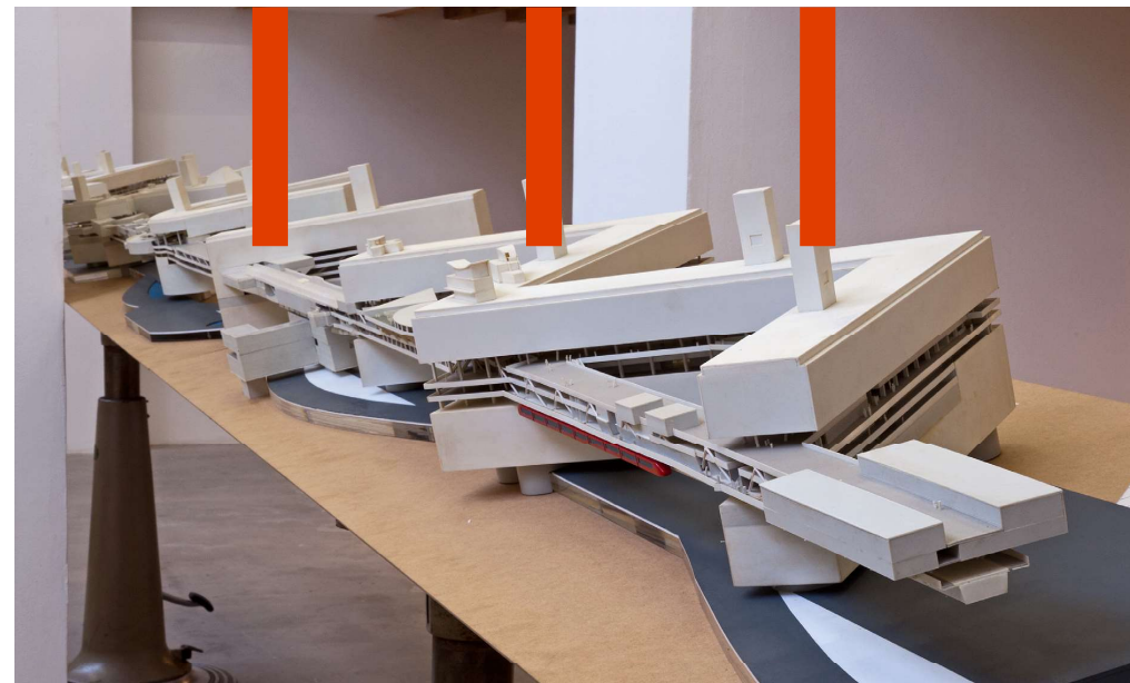
Unadapted City: Dinkytown uit 1998, Luc Deleu